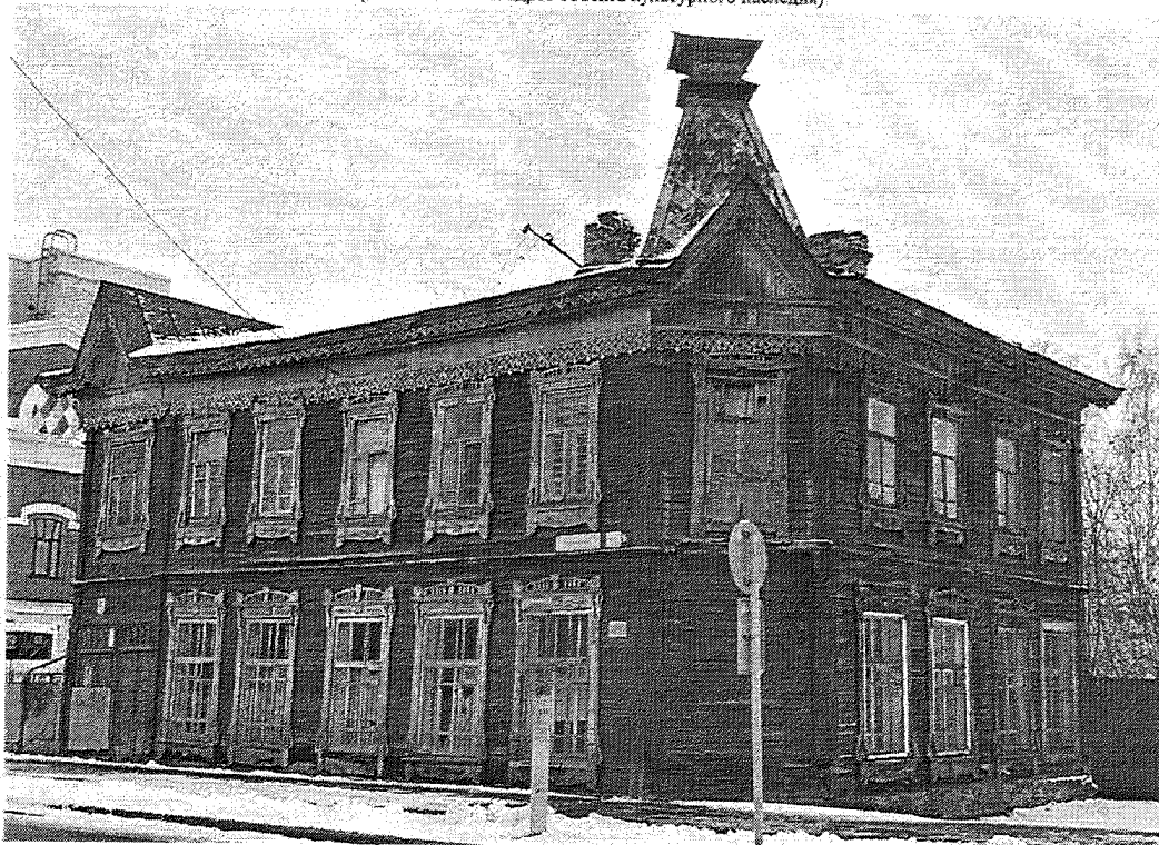
Фото 1 от 28.11.2023. Главный фасад объекта культурного наследия.

«Дом жилой», расположенного по адресу: г. Барнаул, ул. Пушкина, д. 45 (наименование и адрес объекта культурного наследия)