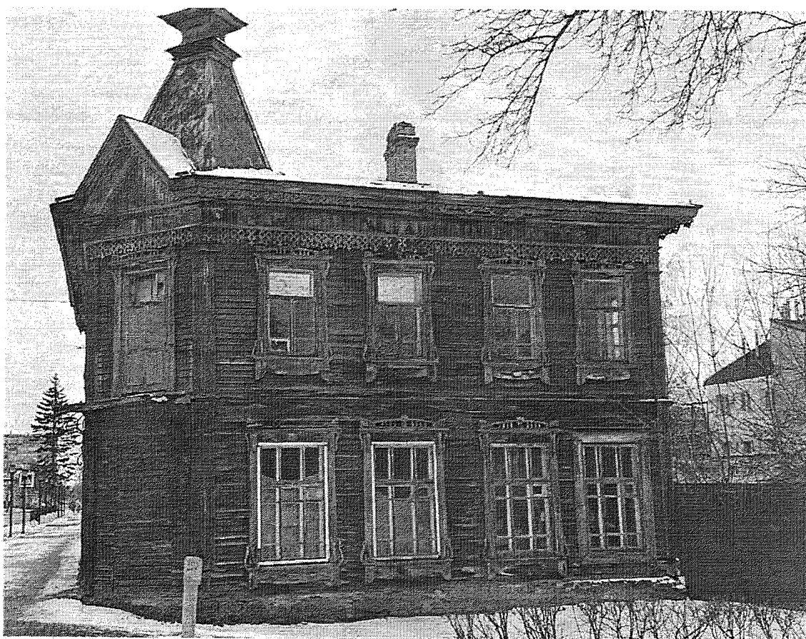
Фото 3 от 28.11.2023. Юго-западный фасад здания.