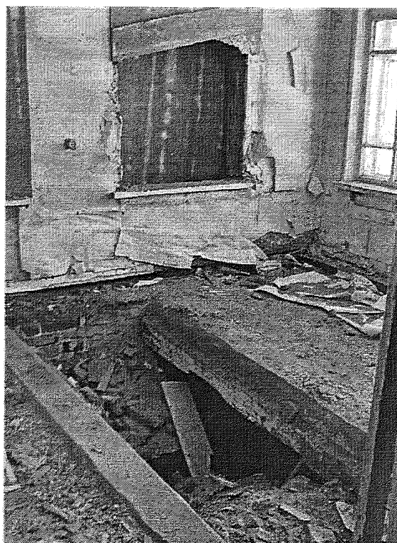
Фото 5 от 28.11.2023. Фрагмент внутреннего помещения первого этажа повреждение полов, промерзание наружных стен, нарушение целостности штукатурного слоя.