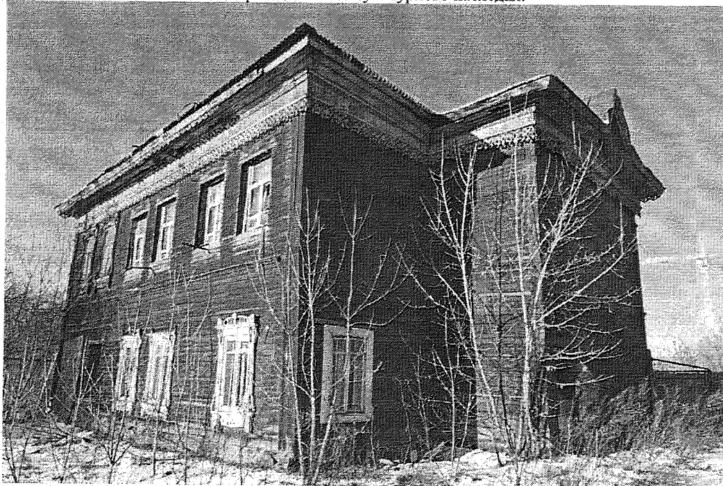
Фото 2 от 28.11.2023. Юго-восточный фасад здания.