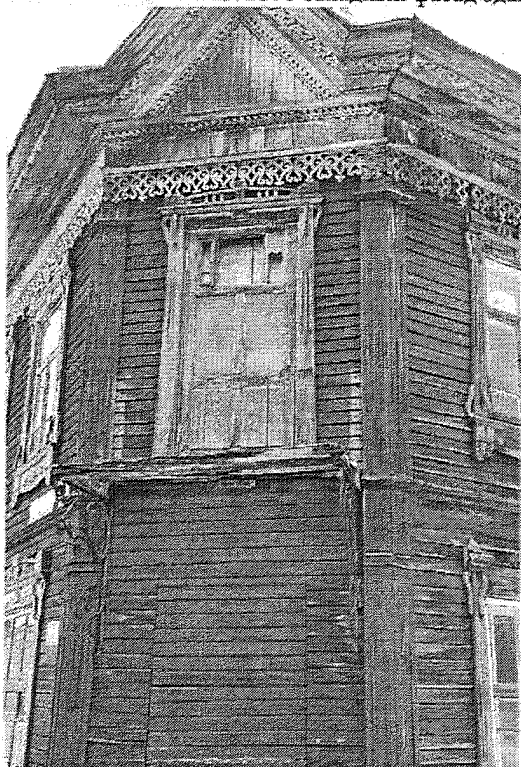
Фото 4 от 28.11.2023. Фрагмент главного фасада, отсутствие балкона в уровне второго этажа.